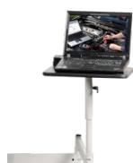
Schwenkarm für Notebooks