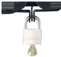
Halterungen und Flügelsschloss