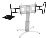
Zwei große, stabile Griffe inklusive Laptop-Ablage