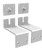
2 verzinkte Wandhalterungen