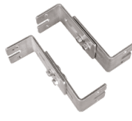
Montagesatz aus verstellbaren Wandhalterungen