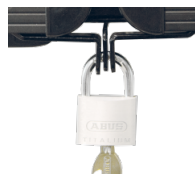
Halterungen und Flügelschloss