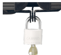
Halterungen und Flügelschloss