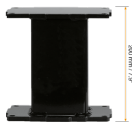
Extender für Aluminiumhubsäulen