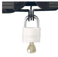
Halterungen und Flügelschloss