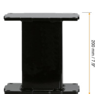
Extender für Aluminiumhubsäulen