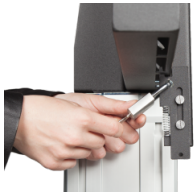
Sicherheits-Vorhängeschloss 1 Stück