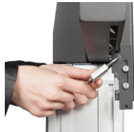
Sicherheits-Vorhängeschloss 4 Stück