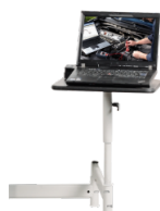
Schwenkarm für Notebooks