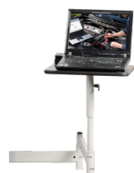
Schwenkarm für Notebooks