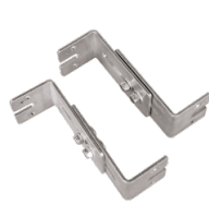
Montagesatz aus verstellbaren Wandhalterungen