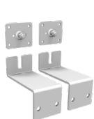
2 verzinkte Wandhalterungen