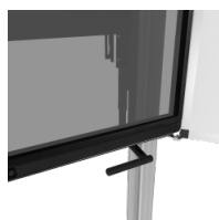
Griff zur Bedienung eines