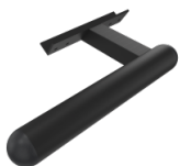
Griff zur Bedienung