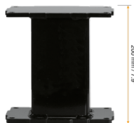
Extender für Aluminiumhubsäulen