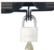
Halterungen und Flügelschloss