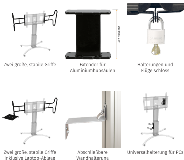
Zwei große, stabile Griffe