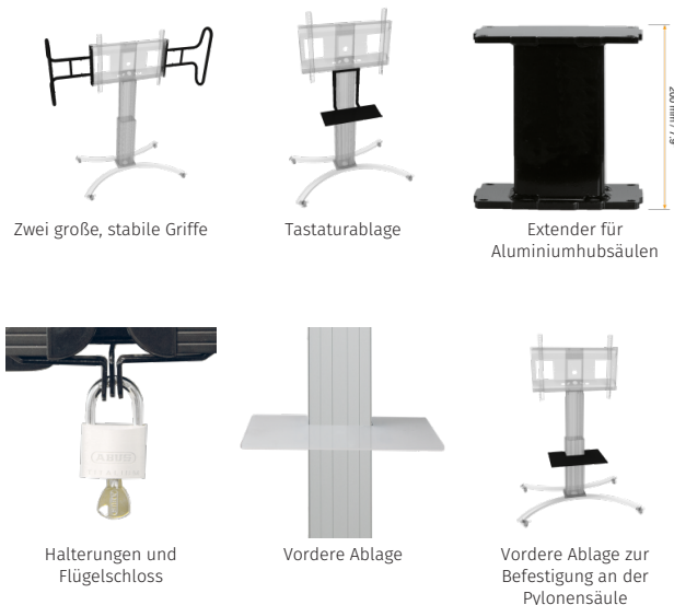
Zwei große, stabile Griffe