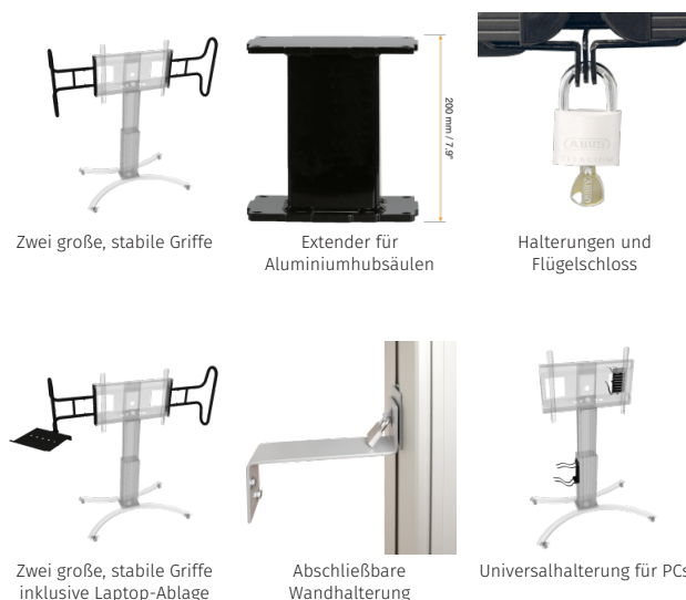
Zwei große, stabile Griffe