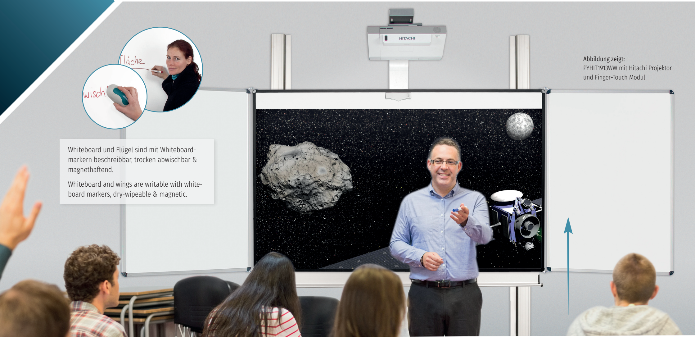
Abbildung zeigt: PYHIT1913WW mit Hitachi Projektor und Finger-Touch Modul

Whiteboard and wings are writable with whiteboard markers, dry-wipeable & magnetic.