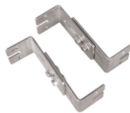
Montagesatz aus verstellbaren Wandhalterungen