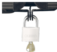
Halterungen und Flügelschloss