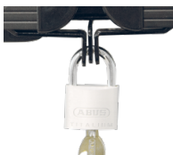
Halterungen und Flügelschloss