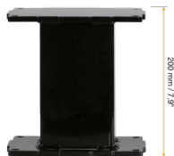
Extender für Aluminiumhubsäulen