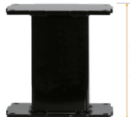
Extender für Aluminiumhubsäulen