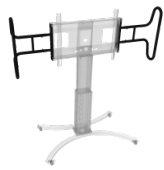
Zwei große, stabile Griffe