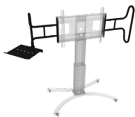
Zwei große, stabile Griffe inklusive Laptop-Ablage