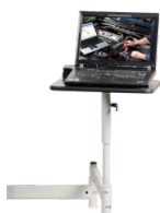
Schwenkarm für Notebooks