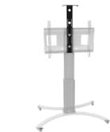
Ablage für Videokonferenz Kameras für Monitore von 65 - 86 Zoll