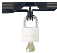
Halterungen und Flügelschloss