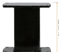
Extender für Aluminiumhubsäulen