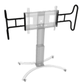
Zwei große, stabile Griffe