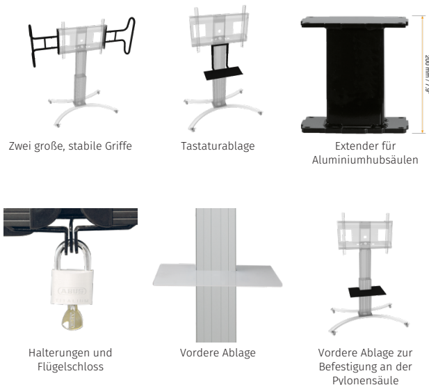
Zwei große, stabile Griffen